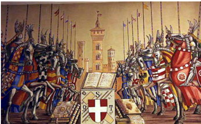
- Famiglie Guelfe e Ghibelline di Asti , sala consigliare Comune di Asti.

Il potere economico sviluppato dalle potenti famiglie mercatali astigiane aumentò grazie anche a sodalizi stipulati con i sovrani d'Oltralpe.