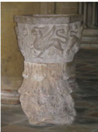
- Capitello corinzio usato come base per acquasantiera. Cattedrale di Santa Maria Assunta.

Il processo di "romanizzazione" durerà dal 200 a.C. fino al 122 a. C., portando Asti ed il suo territorio a costituire un "municipium" romano con il nome di Hasta. Esso precede quello dell'area albese, ed anticipa sensibilmente la costruzione di Augusta Taurinorum .