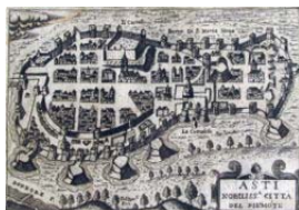
La città di Asti in un'incisione di Francesco Bertelli del 1629

Durante la guerra fra Francesco I e Carlo V , Asti mutò spesso padrone, ma nel 1531 Carlo V la donò a sua cognata Beatrice del Portogallo ( 1504-1538 ), moglie del duca Carlo III di Savoia .