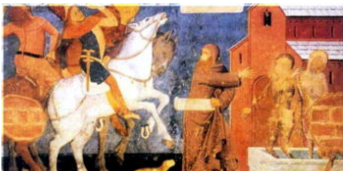
- Carlo Magno e la "danza macabra" di anonimo del XV secolo. Abbazia di Vezzolano, Affresco del chiostro

Il Molina nelle sue "Notizie Storiche profane della lotta di Asti", narra che Carlo Magno , nel 774 giunse ad Asti nell'Abbazia dei Santissimi Apostoli per "ricevere" l'obbedienza della città, in tale occasione avrebbe dispensato alla nobiltà