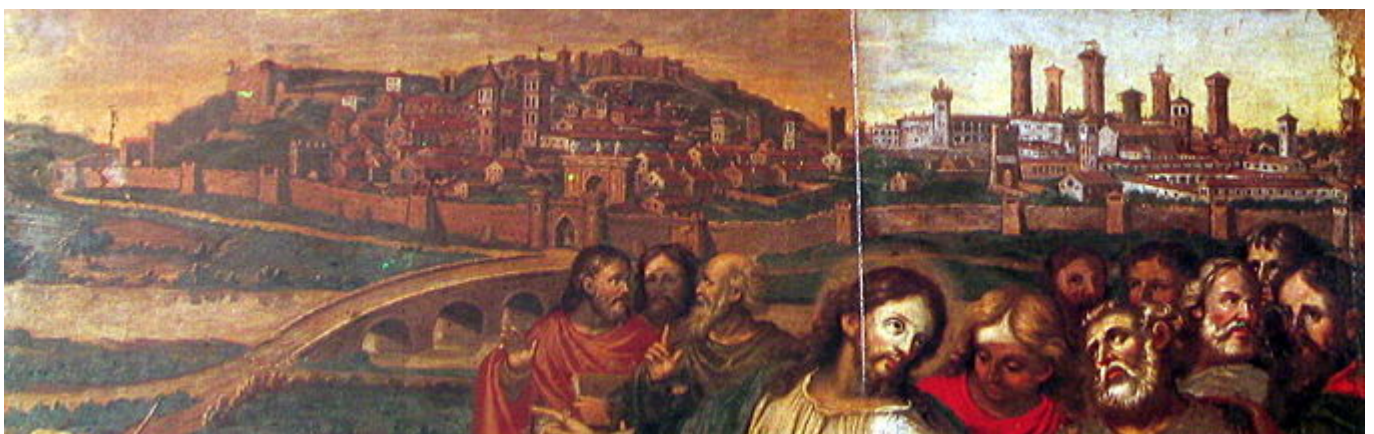
Visione secentesca della città di Asti.Particolare dal dipinto "Cristo e gli Apostoli sulla riva del Borbore".(1670,cerchia di B.Caravoglia)

(da un'iscrizione del Theatro delle città d'Italia con nove aggiunte. Padova, Bertelli, 1629)