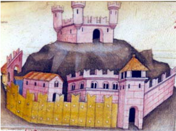
- Codex Astensis. Miniatura del villaggio e del castello di Annone

Il vescovo Oddone III, il 28 maggio 1095, investì il Comune di Asti, nella figura dei suoi consoli, del Castello e del villaggio di Annone, con tutti i diritti ad esso pertinenti.