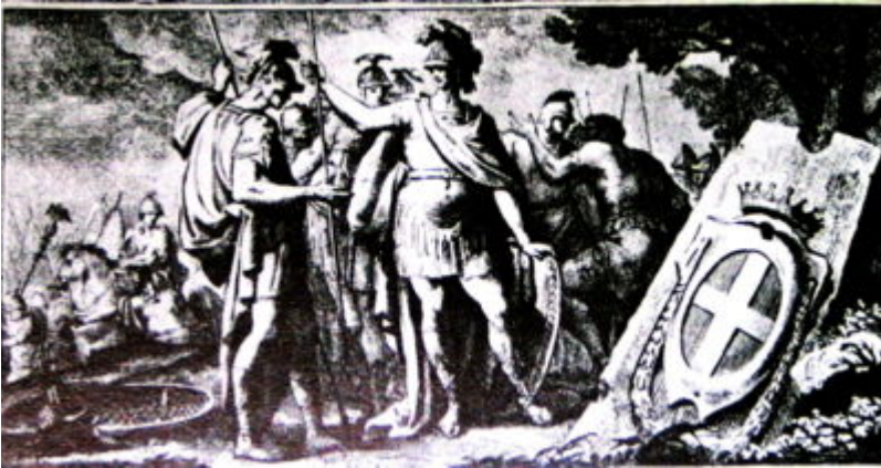
"Dove Pompeo piantò sua nobil asta" (dall' Epithalamia di Giovanni Bodoni (1775).

Fino a qualche decennio fa era opinione di molti studiosi, tra cui Lodovico Vergano, che il nome Asti derivasse dalla matrice ligure "ast" altura, a denominare il primo insediamento abitato sulla collinetta detta dei "Varroni".