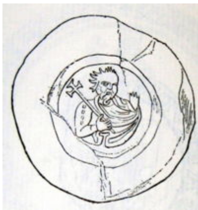
- Sigillo di Adelaide di Savoia

Le alterne vicende politiche europee videro, nei secoli X e XI , un allontanamento della sfera di azione degli imperatori nelle "cose" italiane e in particolare astigiane, sempre più impegnati nelle lotte centrali per la successione e la supremazia dell'impero.