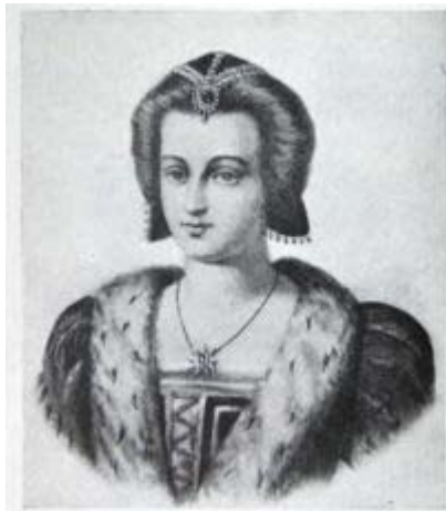
- Ritratto di Valentina Visconti

Sotto gli Orléans, la città ebbe un nuovo periodo di rifioritura e ripresa economica. Luigi di Valois lasciò gli astesi relativamente liberi di amministrare la città.